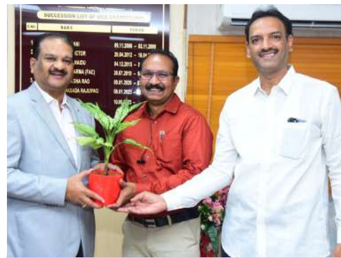
ప్రొఫెసర్, డి.బి.కె. బి.సి.డి.ఎ- సీతావో

ఆదికవి నన్నయ విశ్వవిద్యాలయ ఉపకులపతి ఆచార్య కె పద్మరాజును మర్యాదపూర్వకంగా కలిసి శుభాకాంక్షలు తెలియజేసిన ప్రముఖులు.